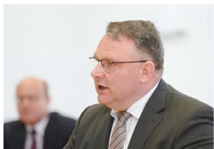
// Christian Hartmann