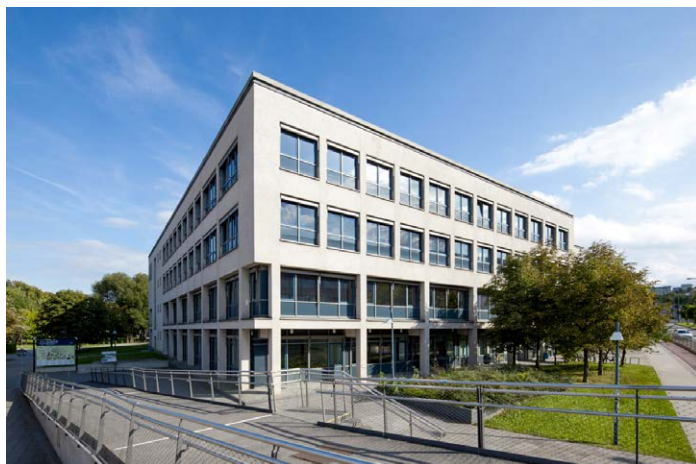
// Von-Gerber-Bau der TU Dresden

Die ursprüngliche Schutzfunktion der Staatsgewalt für die junge evangelische Konfession in der Reformationszeit hatten die Fürsten kraft ihrer Territorialgewalt im Laufe des 16. Jahrhunderts auch auf innerkirchliche Angelegenheiten erstreckt. Das erlaubte ihnen in der noch stark geistlich geprägten Gesellschaft, die staatliche Autorität weiter auszudehnen. In der Folge kam es zur Behandlung der Kirche als einer staatlichen Einrichtung mit enger Verflechtung kirchlicher und staatlicher Verhältnisse und einer Verschmelzung der kirchlichen und staatlichen Verwaltung. Im 19. Jahrhundert strebten die Kirchen zunehmend nach Eigenständigkeit. Die Unterscheidung zwischen der aus der Staatssouveränität begründeten Oberhoheit über alle Konfessionen und der nur übertragenen Kirchengewalt gewann an Bedeutung. Sie zielte auf die Trennung