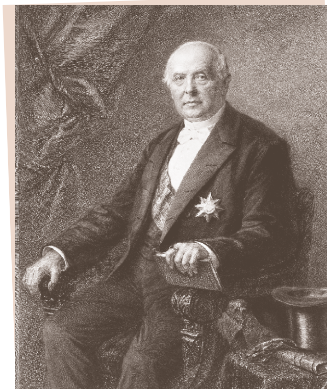
Porträt Karl von Gerber

Nach kurzer praktischer Tätigkeit als Jurist im »Fürstlichen Amt Eisleben« entschied er sich für die akademische Laufbahn. Er wurde außerordentlicher Professor in Jena, wenig später ordentlicher Professor in Erlangen. Zu diesem Zeitpunkt war er 24 Jahre alt und wohl einer der jüngsten ordentlichen Professoren. Bereits wenige Jahre später veröffentlichte er sein aufsehenerregendes zweibändiges Werk über das »System des deutschen Privatrechts«, in dem er das deutsche Privatrecht streng systematisch-begrifflich und juristisch-konstruktiv darstellte. Es prägte damit die Privatrechtslehre über Jahrzehnte.