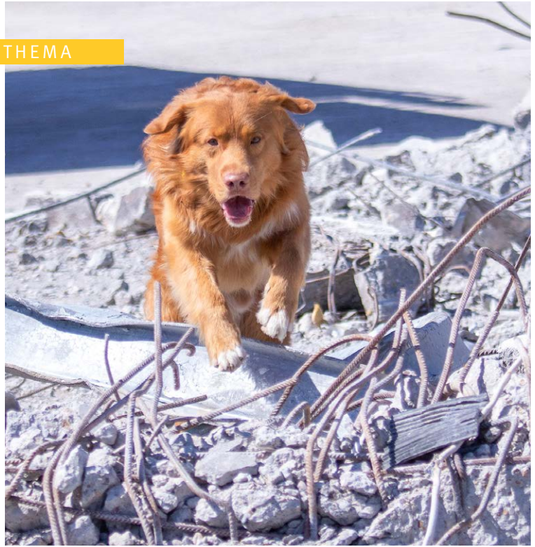
// Hund bei der Trümmersuche

Zwei Rettungshundestaffeln unterstützen den Katastrophenschutz in Sachsen