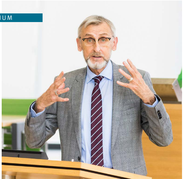
// Armin Schuster