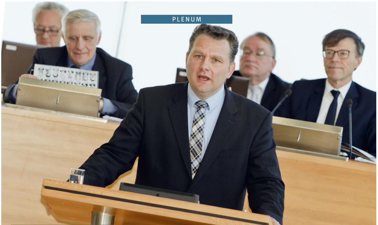
33. Sitzung des Sächsischen Landtags

// Christian Hartmann // Foto: R. Deutscher