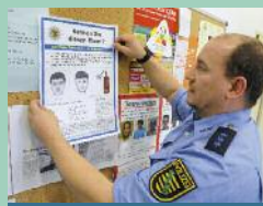
Seite 9: Hintergrundinformationen zur Polizeilichen Kriminalstatistik 2015