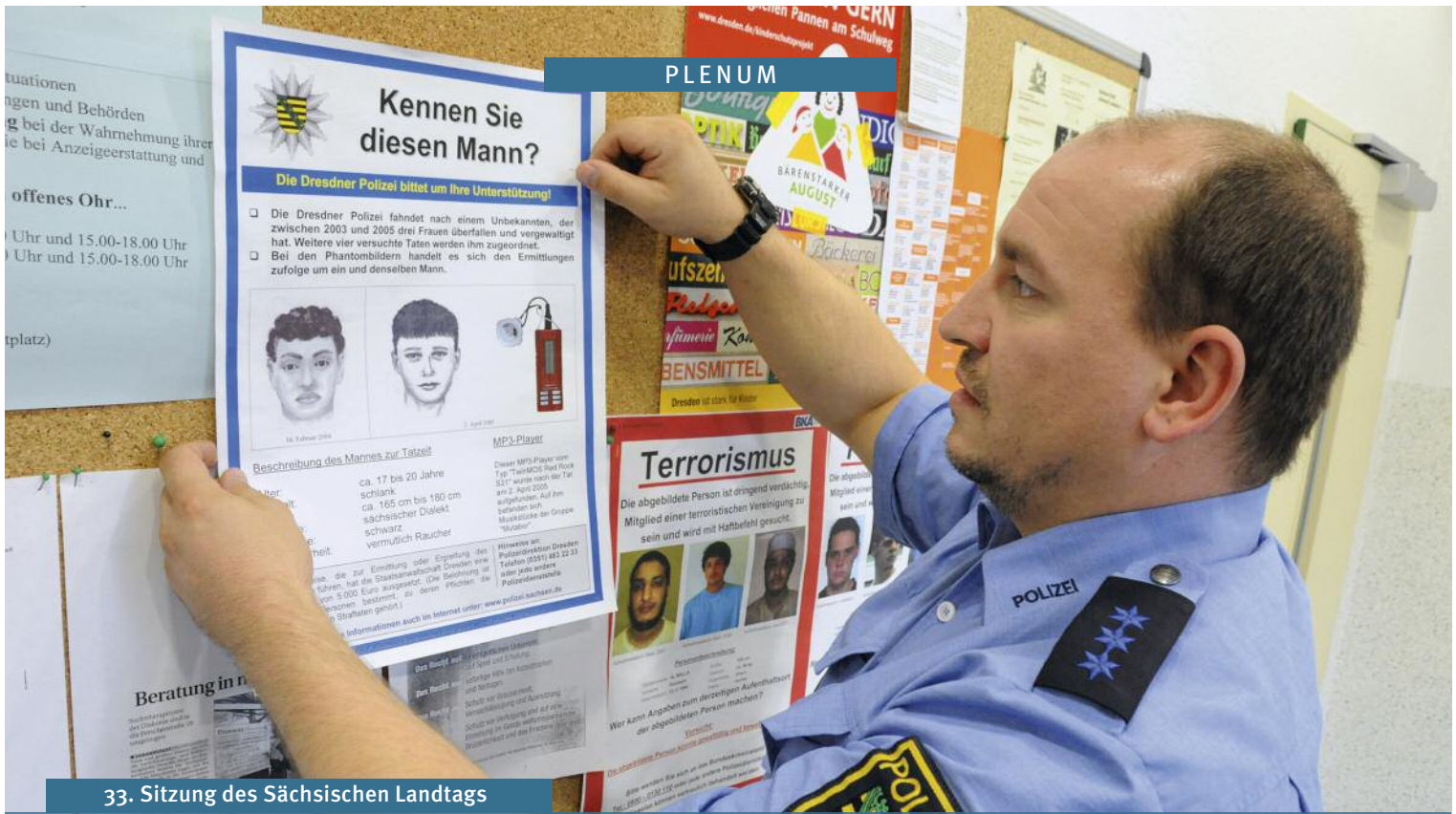
33. Sitzung des Sächsischen Landtags