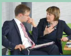
Seite 4: Wissenschaftsland Sachsen weiter profilieren