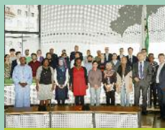
Seite 11: Ausländische Studenten im Sächsischen Landtag zu Gast