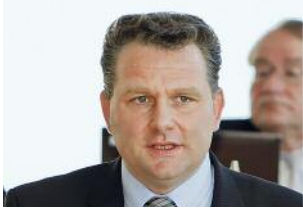
// Christian Hartmann