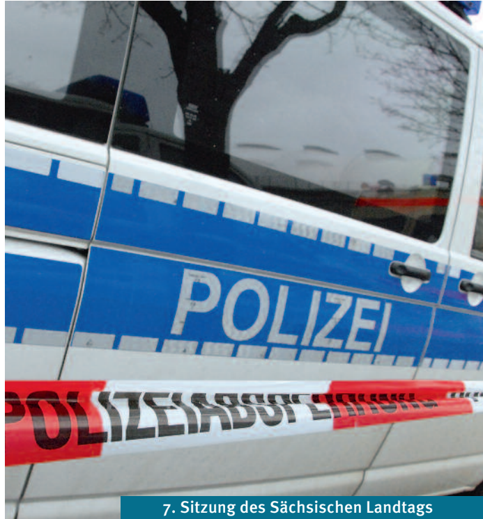
7. Sitzung des Sächsischen Landtags

Die AfD fragt nach dem Stellenwert der Polizei in Sachsen