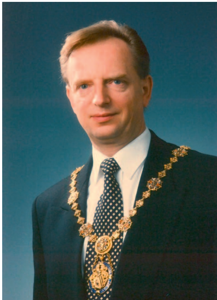
// Dr. Herbert Wagner

Dresden, führte er am 5. Dezem-ber eine Demonstration zum Gebäude der Staatssicherheit. Die geglückte Besetzung der Staatssicherheit war für ihn der Beleg für die Unumkehrbarkeit der friedlichen Revolution. Wagner jubelte am 19. Dezem-ber 1989 in Dresden Helmut Kohl zu, als dieser vor der Ruine der Frauenkirche eine ihn bewegende Rede hielt. Im Januar 1990 folgte der Fraktionsvorsitz der Basisdemokratischen Fraktion