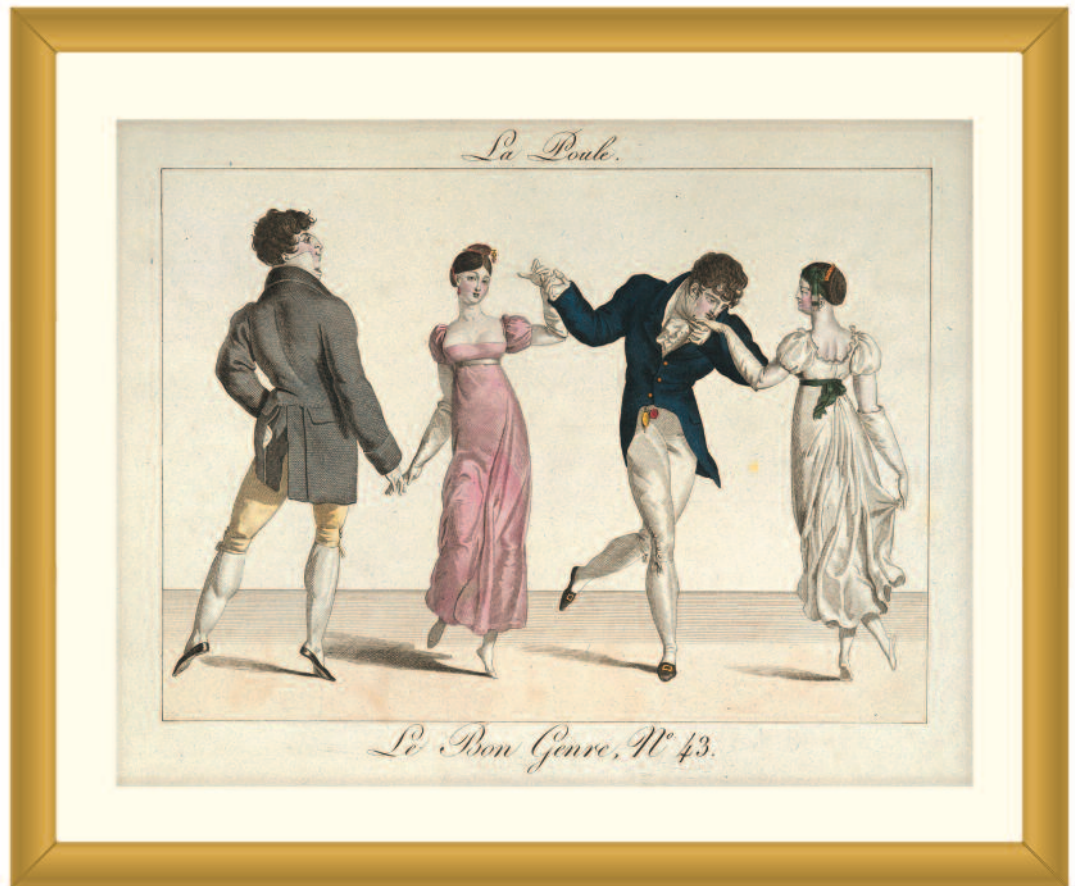
»La Poule« – »Die Henne«: Dritte Figur der Quadrille-Française, Kupferstich 1801