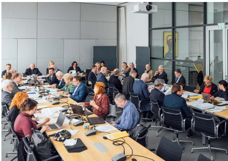
Petitions-Ausschuss, Foto: Oliver Killig

Wenn der Abgeordnete alles Wichtige zu der Petition weiß, kann er einen Bericht schreiben.