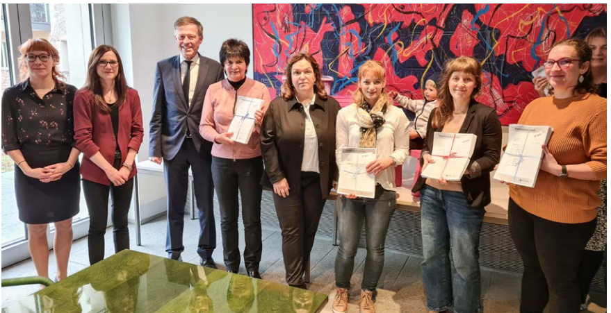
Übergabe einer Unterschriften-Liste an den Landtag

Sie steht auch im Internet auf der Seite vom Landtag.