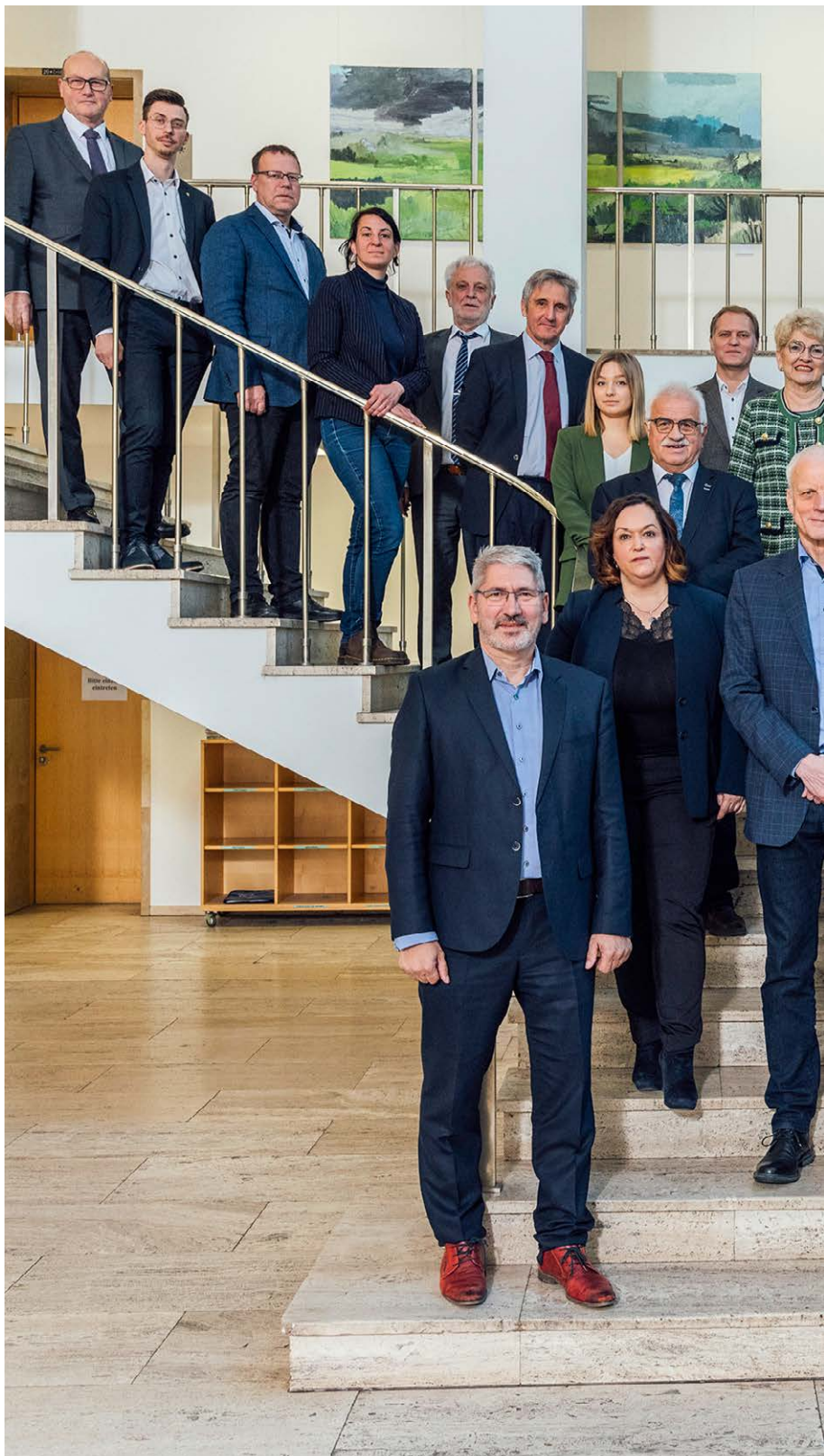
Mitglieder vom Petitions-Ausschuss