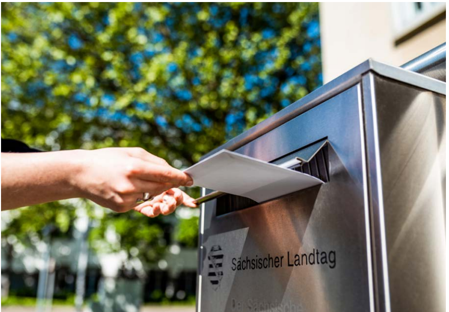
Briefkasten vom Landtag